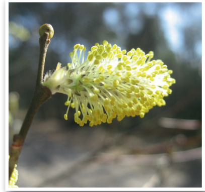
Frühlingsausgabe, März 2013

jedem Fall gewonnen, und wir wollen versuchen, regelmäßig und kontinuierlich an der Zukunft Nartums zu arbeiten und die Wohnqualität in unserem schönen Ort stetig zu steigern. Wir werden Euch auf dem Laufenden halten. (lr)